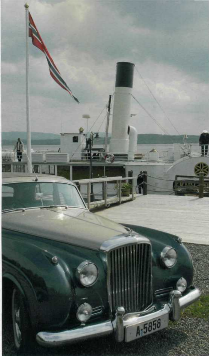
Hoel gård er en storgård med veteranbiler, lønneallé og egen brygge for Skibladner. Vi ble fraktet til hjuldampere i en Bentley fra 1958.

Gregoriansk sang i de rette omgivelsene kan sette selv black metalband i sakral stemning. Slik opple-