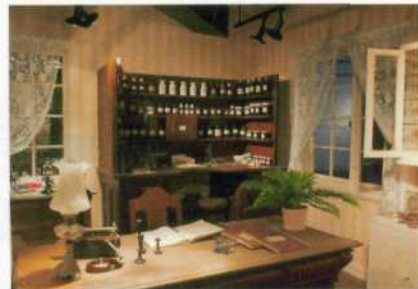
På Glåmdalsmuseets utstilling "Gammeldoktoren" kan du se hva legene drev med lenge før dataalderen. Skumle greier!

Bryggeriet, der eks-offiser og jeger Per Walmsnæss bobler om kapp med brygget.