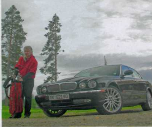
Sorknes golfbane er nærmeste nabo til en av Akevittrutens stoppesteder, Norlandia hotell på Rena.