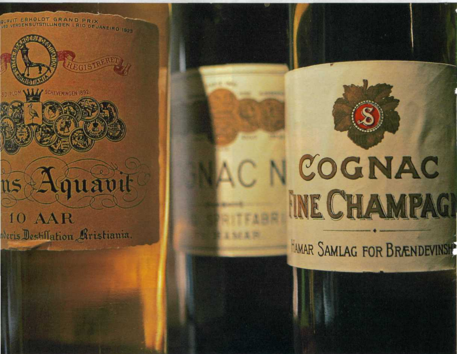
Som flaskene fra Hoel gård viser, var det ikke så nøye med hvilke etiketter man klistret på utblandet råsprit i gamle dager.

I potetfylket Hedmark har man opp gjennom tidene kunnet skue like mange brenneritårn som kirkespir. Dette avspeiler en folkelig tradisjon hvor poteten – i tillegg til å være middagsmat på vikende front – også er utgangspunkt for mer for-edlede varer. Og da tenker vi ikke på potetgull, men på "aqua vitae" – livets vann.