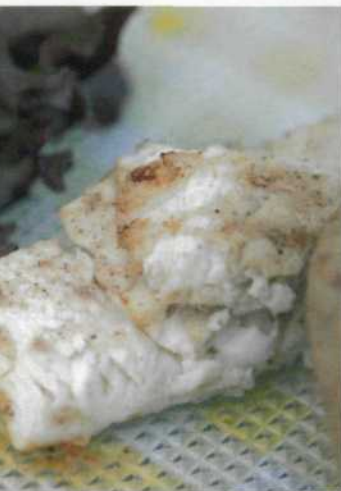
Store Gillund gård fristet oss blant annet med akevittmarinert, grillet hellebarn.

i løpet av en sommer; Skibladner passerer denne grensen flere ganger på sin vei over Mjøsa. Akevitten avnyttes i Herresalongen, med brede stoler tilpasset høy sigarføring.